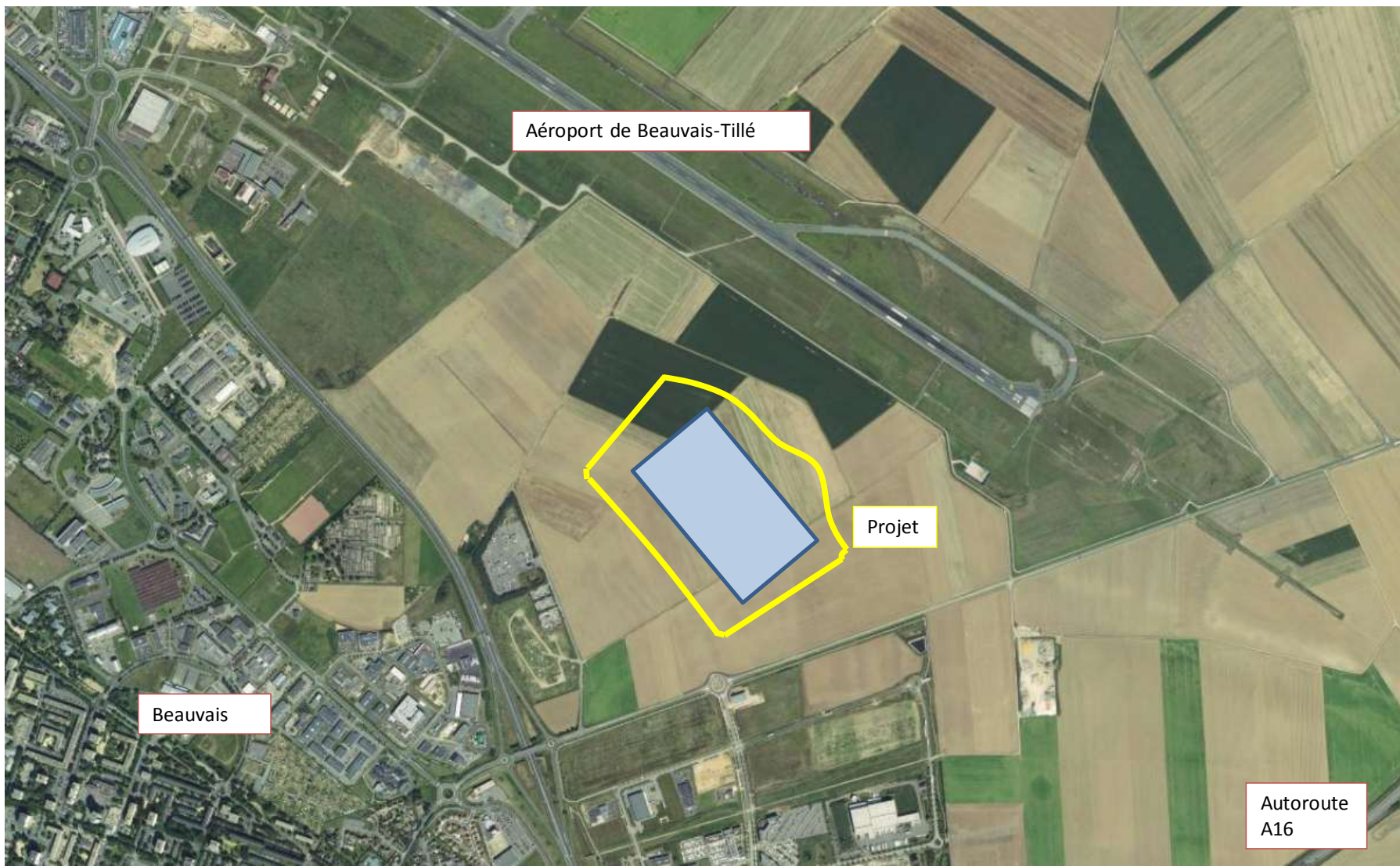
Photo aérienne de l'environnement de la parcelle d'implantation